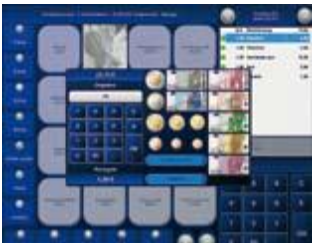
Barrechnung / Wechselgeld